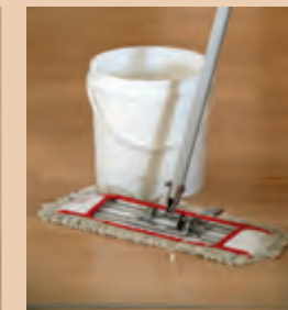
2. Feuchtreinigung mit HYDRO CLEANER