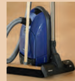
1. Trockenreinigung mit Staubsauger oder Besen

Keine Verwendung von Mikrofaser-tüchern, da diese den Boden verkratzen können.