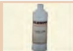
HYDRO CARE Art. 024-000-00753