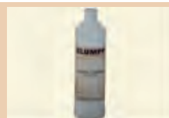
HYDRO CLEANER Art. 024-000-00755